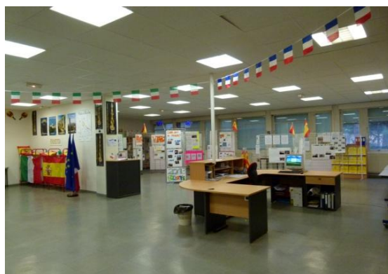
Le CDI est aussi un lieu d'expositions, comme ici pendant la semaine Comenius en mai 2013