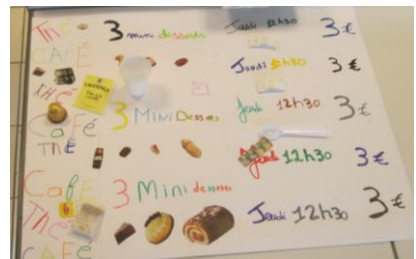
Affiche pour le café gourmand